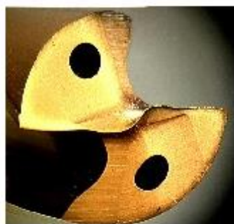
肯纳的 SE 钻尖