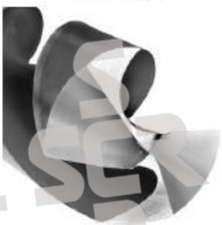
十字/四小平面钻尖